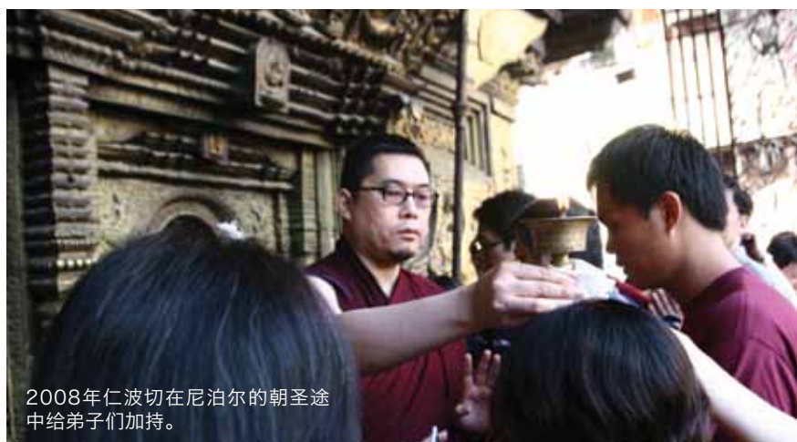
2008年仁波切在尼泊尔的朝圣途中给弟子们加持。

仁波切将其生命奉献给一个远远超过他个人欲望的事业。在他的生命当中，他总是走出自己的“舒适地带”。他选择启发其他人，让我们不只是靠着自己的执念来思考，而以一种更为宏远、宏大的心态来度过我们的人生，同时也让我们度过超乎我们所想象的优越人生。