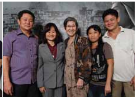
四位讲法师与其家人及朋友一同出席当天的仪式并欢庆这桩喜事。