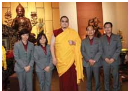
尊贵的詹杜固仁波切及四位刚被授任的讲法师。