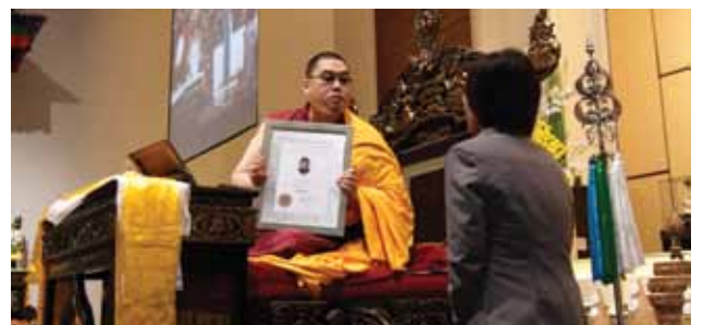
每位讲法师都获得一张证书以执行授任为讲法师的职务。

除此以外，克切拉的讲法师将被授权为社区提供多种服务，而这些服务过去都只限于佛教僧人和女尼才能进行，如葬礼、婚礼、加持家居、法会、佛法教学等。愿克切拉首组被授任的讲法师能为这个地区对修行日渐增多的需要做好准备，以铺平未来的道路，以便实现更多讲法师的授任。