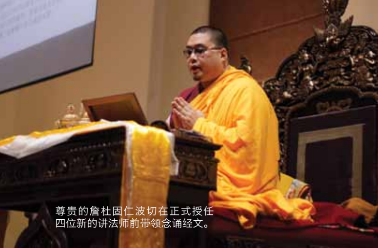
尊贵的詹杜固仁波切在正式授任四位新的讲法师前带领念诵经文。