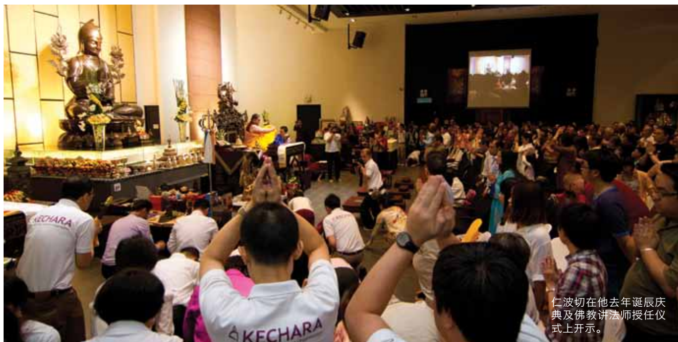
仁波切在他去年诞辰庆典及佛教讲师授任仪式上开示。

在《走出山洞》的这个新单元中，我们有机会深入了解仁波切的生平，发掘他可供我们学习的非凡个人经历。这一期，让我们来了解仁波切如何为了他人的利益而放下个人欲望。